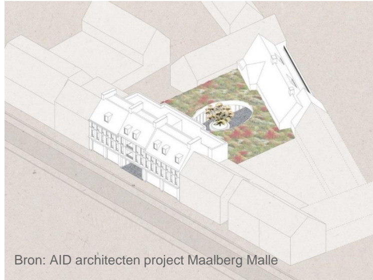
Bron: AID architecten project Maalberg Malle