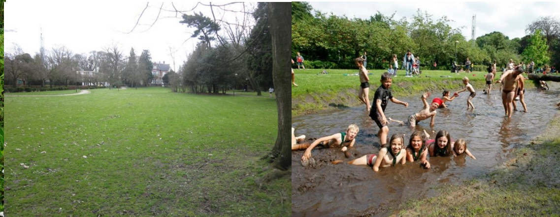
Voor Bron: Eeklo